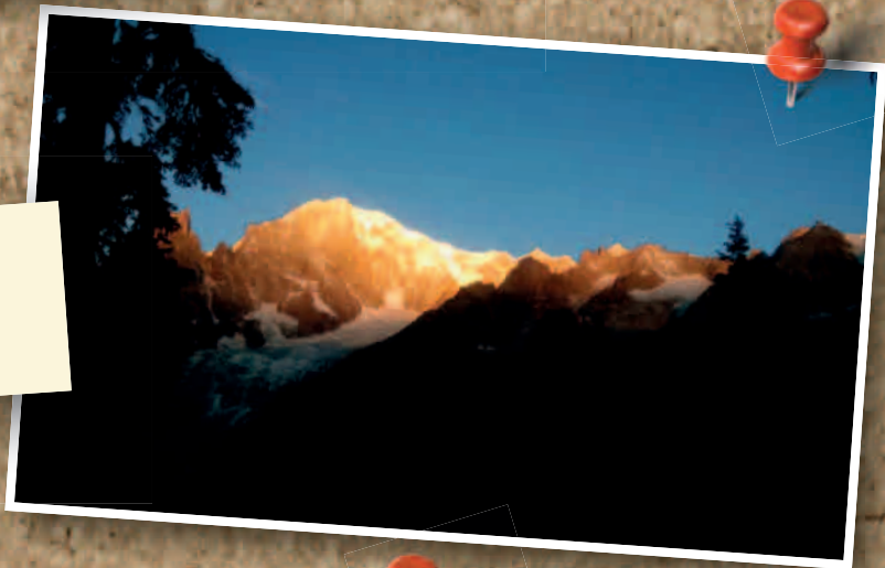
“Sua Maestà” di Alberto Cattellino