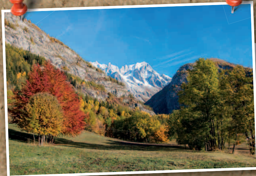
Autumn in Courmayeur di Giuseppe Di Mauro