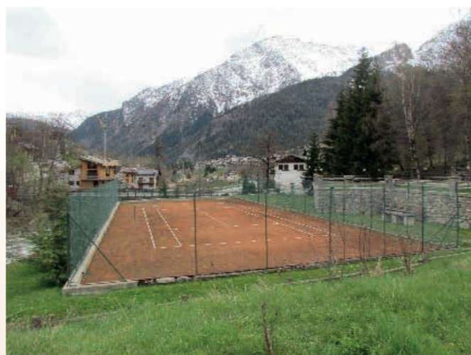
Capo Tennis Condominio Les amis- La Villette