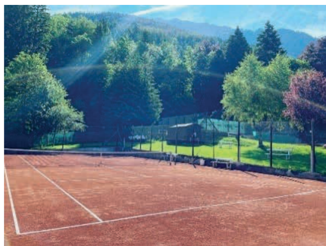
Campo tennis Croux al Pussey